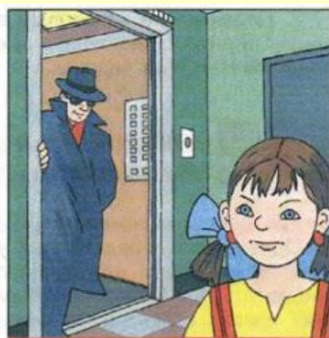
Не входите в лифт с незнакомыми людьми