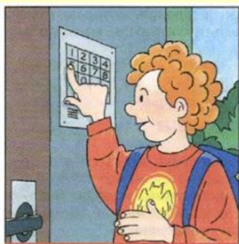
Пользуйтесь домофоном, чтобы вас встретили в подъезде